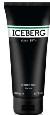
Shower Gel 200 ml