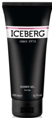
Shower Gel 200 ml